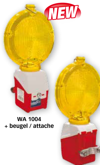
WA 1004 + beugel / attache

Leverbaar vanaf 04/2016 • Livrable à partir du 04/2016