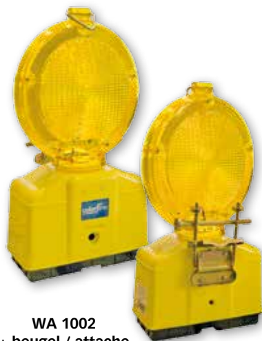
WA 1002 + beugel / attache