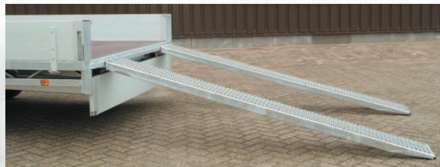
▲ Rampes, 250 cm de longueur