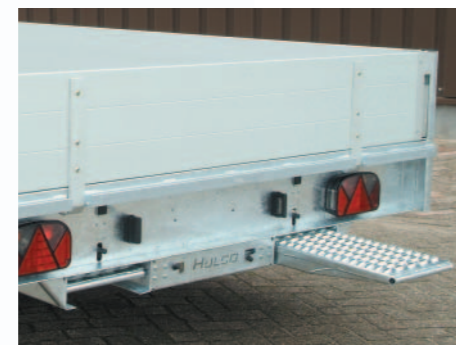
▲ Emplacements pour rangement des rampes sous le châssis