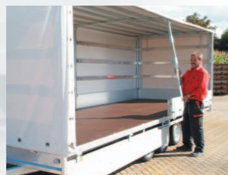
▲ Bâche accessible sur les quatre faces, pilier central amovible