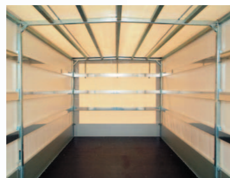
▲ Armatures de la bâche très stables avec les barres aluminium